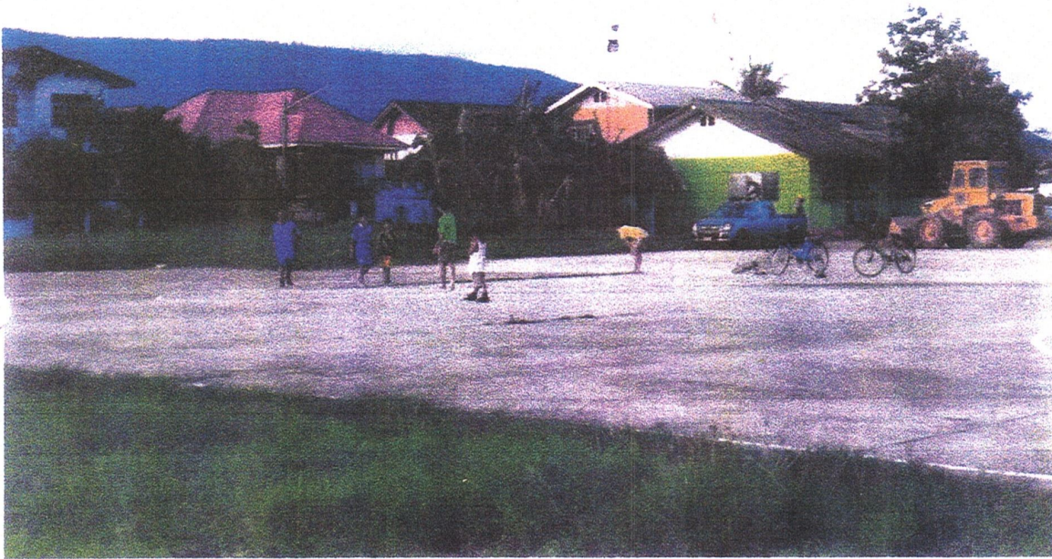
สนามกีฬาบ้านไชยสอ ม.2